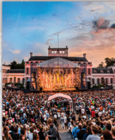
ROYAL PARK LIVE PALEIS SOESTDIJK