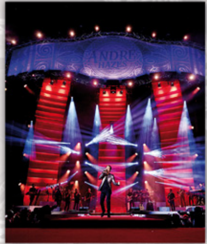
ANDRÉ HAZES LIVE ROTTERDAM AHOY