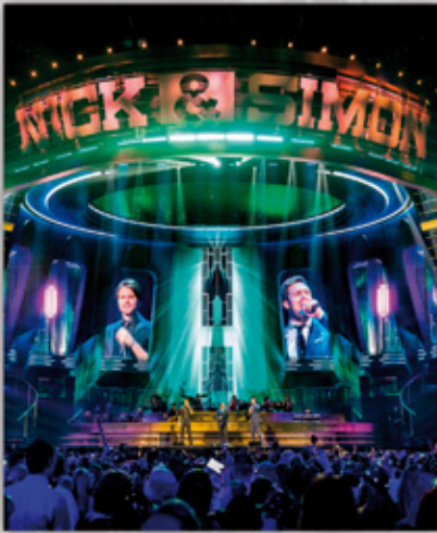
10 JAAR NICK & SIMON ROTTERDAM AHOY