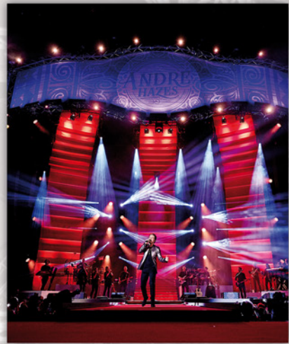
ANDRÉ HAZES LIVE ROTTERDAM AHOY