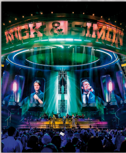
10 JAAR NICK & SIMON ROTTERDAM AHOY