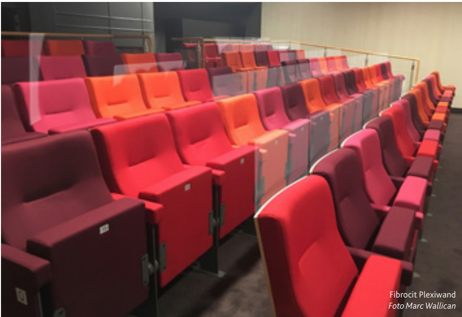
Fibrocit Plexiwand