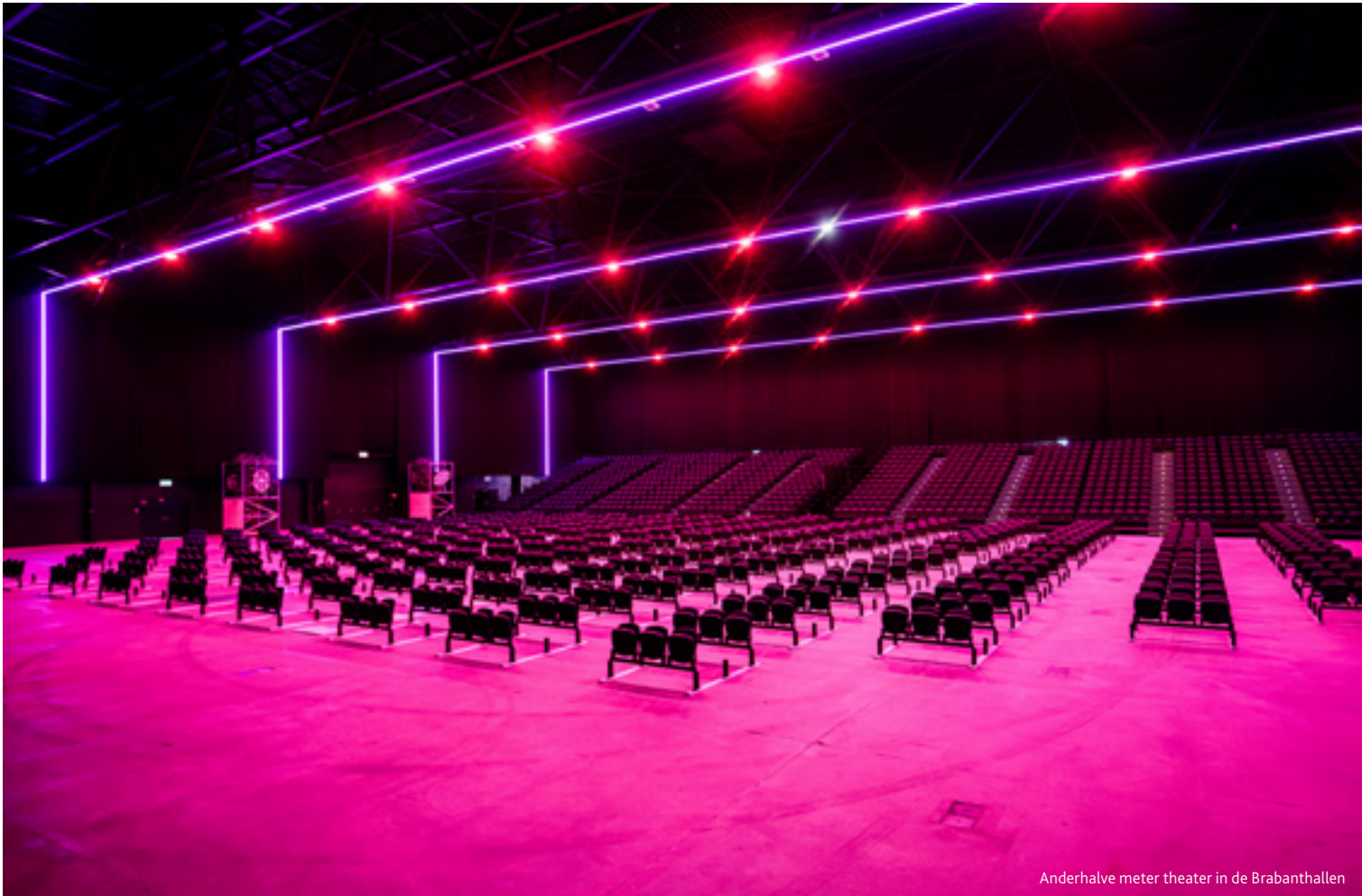
Anderhalve meter theater in de Brabanthallen