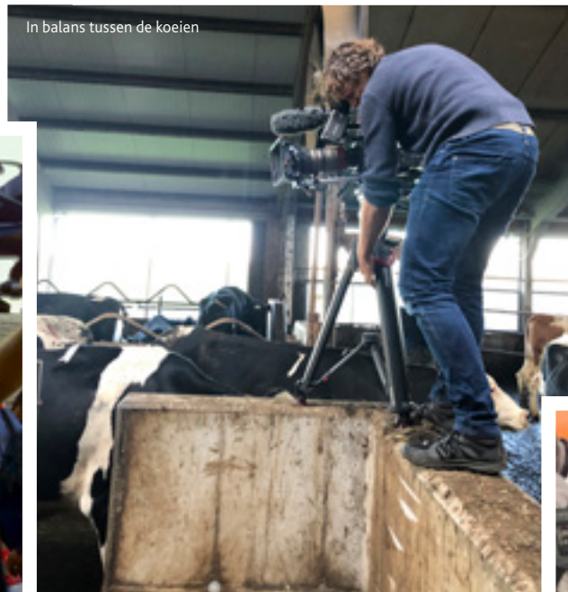
In balans tussen de koeien