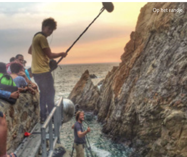
Op het randje