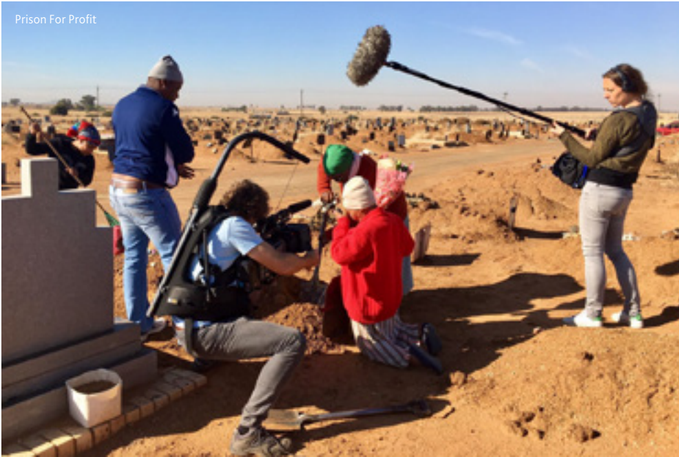
Prison For Profit

zen wisselen. De Angenieux doet echter amper onder voor prime lenzen." Tot nog toe neemt Bouma zijn zware camera/lens-combinatie voor lief, omdat het goed is als de shots die hij maakt ook dat gewicht hebben en de shots echt 'staan'. "Omdat ik veel handheld draai, gebruik ik een Easy Rig die ik extra stabiliseer. Op die manier kan ik nog beter draaien met een zekere rust en cadans. Maar gezien mijn bezoeken aan de fysio de afgelopen jaren, zit ik nu toch wel te denken aan een lichtere opvolger."