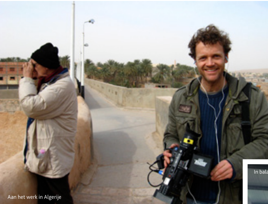
Aan het werk in Algerije