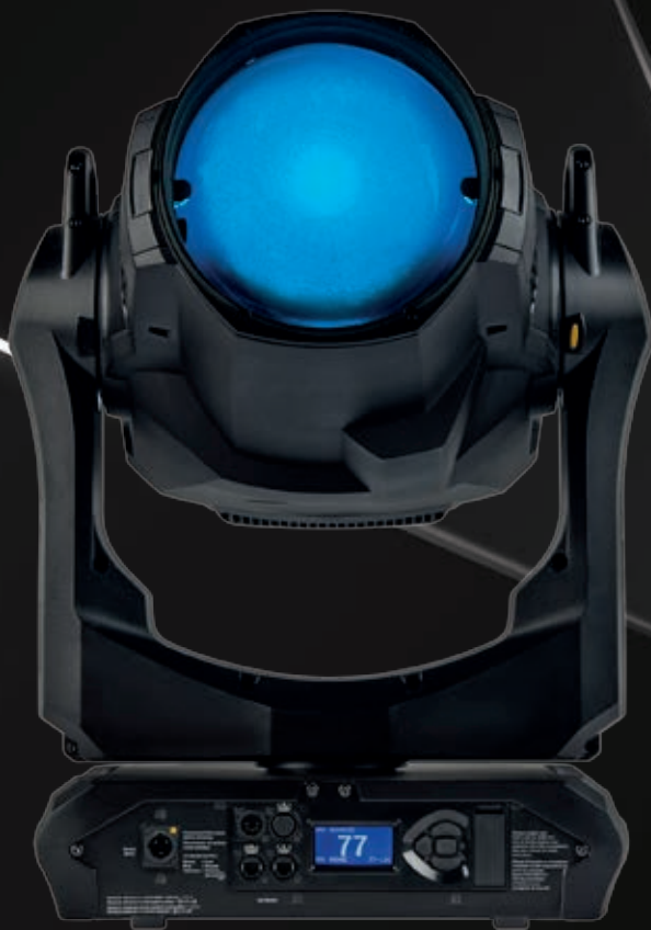
MAC Ultra Wash