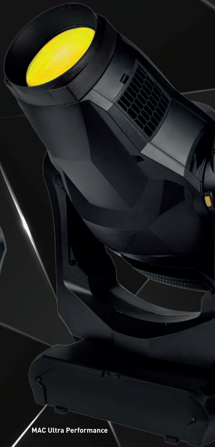
MAC Ultra Performance