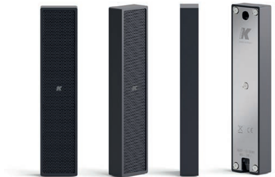
De Lyzard van K-Array

Bij K-Array was onder andere de K-array Lyzard Mk I te bewonderen. Fraaie prestaties in een minuscuul lichaam, daar komt het op neer. Lyzards (de range bestaat uit de Lyzard-KZ1 I en Lyzard-KZ14 I) zijn ontworpen voor discreet gebruik in verschillende intieme omgevingen, zoals detailhandel, chique restaurants, bars en musea. Niet groter dan een chocoladereep, biedt het de beste geluidservaring met minimale visuele impact. Installatie is eenvoudig dankzij de magnetische grille. Een breed scala aan kleuren en luxueuze metalen afwerkingen zorgen daarvoor alle Lyzard-modellen passen naadloos in elk interieur. <