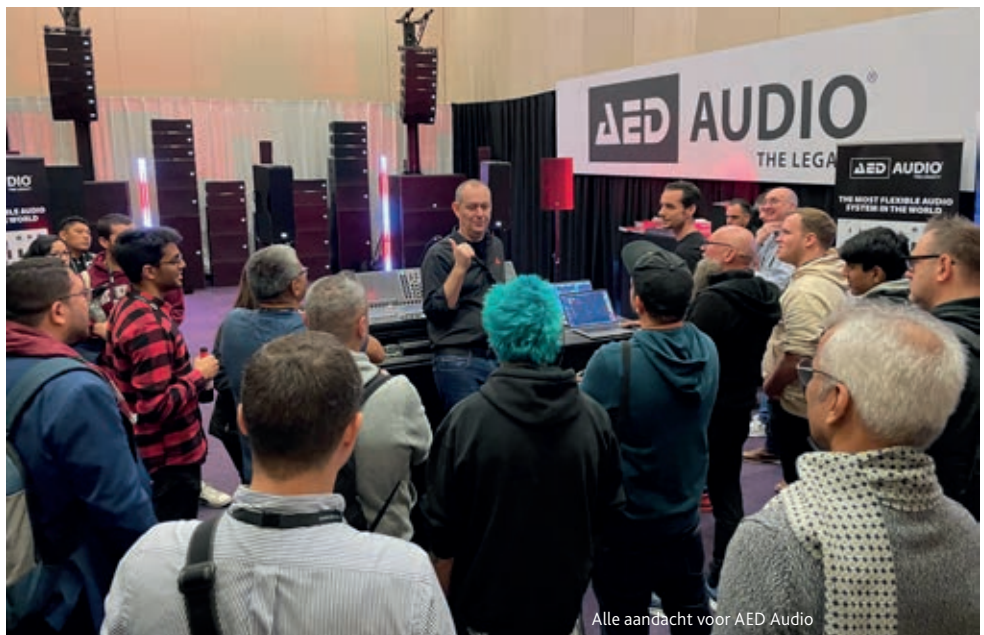
Alle aandacht voor AED Audio

Op de stand van NST Audio waren verschillende DSP's te zien die voor zowel installaties als touring geschikt zijn door hun grote flexibiliteit en zeer gebruiksvriendelijke D-net software. De VMX88 8-in/8-uit matrix DSP is nu ook met Dante uitgevoerd, waardoor eenvoudige implementatie binnen een compleet digitale set-up ook mogelijk is. Het huidige VR-1 installatiepaneel biedt nu al een zeer uitgebreid functie-