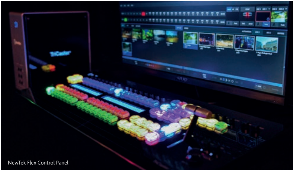
NewTek Flex Control Panel

ingebouwd bieden operators meer precisie en controle dan elke ander beschikbaar control panel. Met de toevoeging van audio-I/O breidt Flex onmiddellijk de ingebouwde I/O van elke TriCaster uit met de optie om externe bronnen rechtstreeks aan het NDI-ecosysteem toe te voegen. Flex is het enige NewTek-control panel dat eenvoudig verbinding maakt met een netwerk middels NDI en controle heeft over elke videoswitchers op dat netwerk, waardoor operators de ultieme productievrijheid krijgen. Flex biedt operators ook alles wat ze nodig hebben voor gedistribueerde producties door met alle huidige TriCaster-modellen te werken.