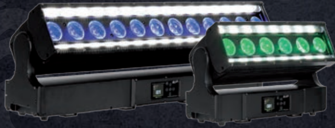
PROTEUS RAYZOR BLADE L™ PROTEUS RAYZOR BLADE S™

The PROTEUS RAYZOR line of pixel-controllable RGBW LED lights features Elation's proprietary SparkLED™ background illumination system for an extra layer of effect that adds that something extra to any show, indoors or out .