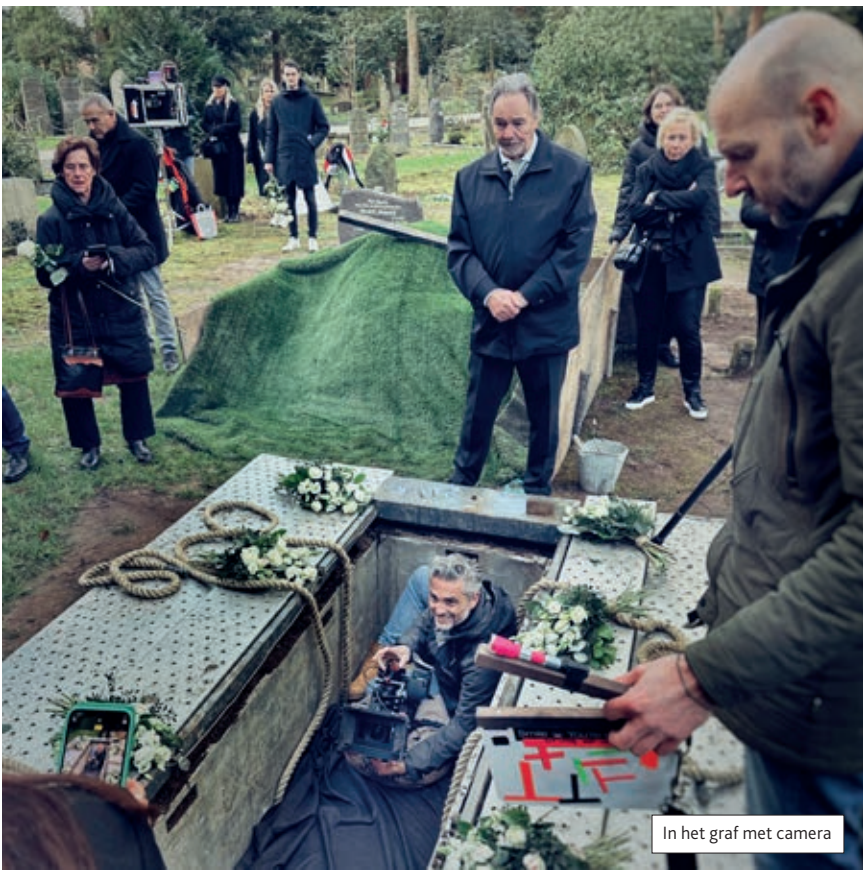
In het graf met camera