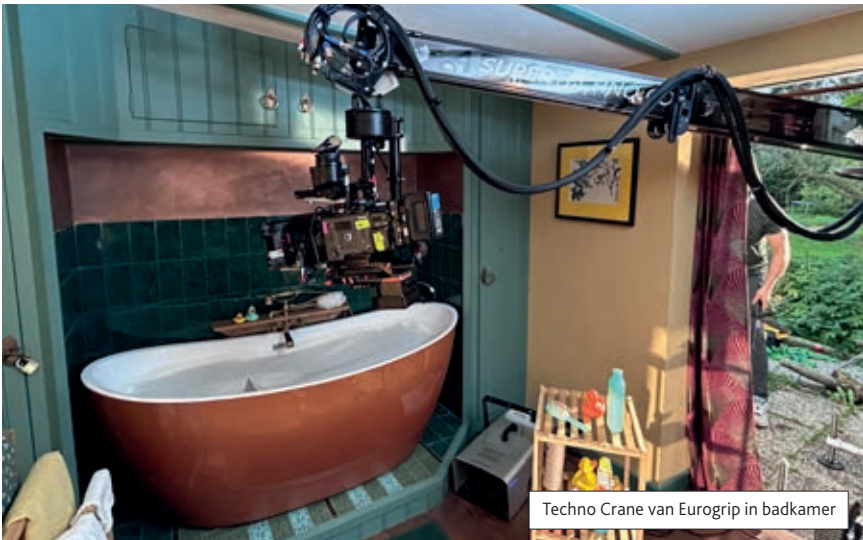
Techno Crane van Eurogrip in badkamer