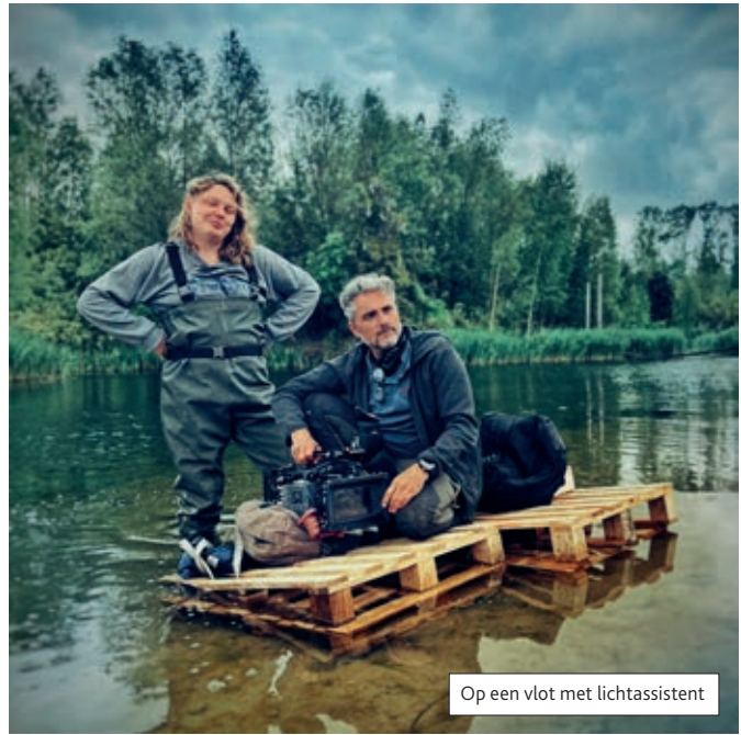
Op een vlot met lichtassistent