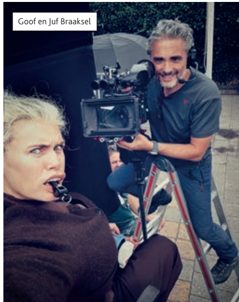
Goof en Juf Braaksel