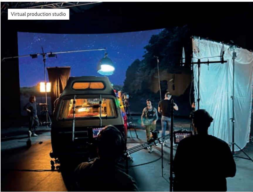
Virtual production studio