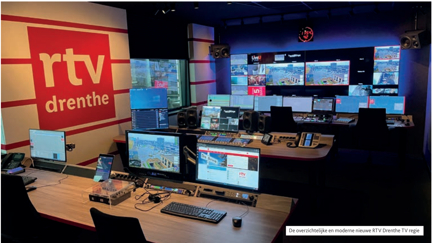
De overzichtelijke en moderne nieuwe RTV Drenthe TV regie