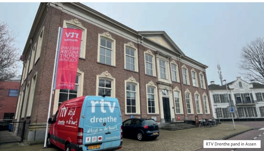
RTV Drenthe pand in Assen

De redactie van RTV Drenthe en de vaste medewerkers in de regie (zelfschakelende regisseurs) zijn vanaf het begin van het project nauw betrokken geweest, waardoor een soepele integratie van de nieuwe werkwijze ontstond en alle wijzigingen tot op de dag van vandaag relatief snel in gezamenlijkheid gerealiseerd kunnen worden. "Dat is toch ook wel het leuke van werken bij