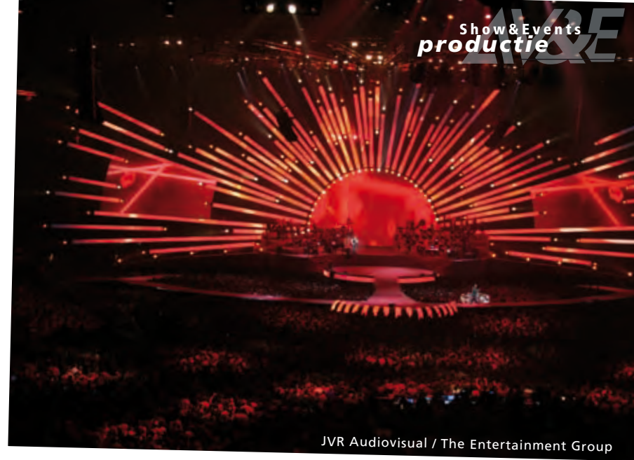
JVR Audiovisual / The Entertainment Group

zijn bij dit soort producties een serieuze uitdaging: full-range audio voor maximale spraakverstaanbaarheid en comfort (het zijn lange dagen) en continu betrouwbare werking door het hele stadion. Bij dit laatste ligt de uitdaging in de grote afstanden, de vele metalen constructies, het grote aantal frequenties in de lucht ter plaatse en de algemeen toenemende frequentie problematiek (DVB-T etc.). Daniel Kee (Project leider AEM): "Het leuke is dat elke show weer anders is dan de vorige, en ook op de locatie aangekomen kan een ogenschijnlijk klein verzoek uit de productie verregaande consequenties hebben. Maar als de show eenmaal draait en we horen op de lijnen dat de communicatie rustig en soepel loopt doet dat erg plezier. En dat was hier dus zeker het geval."