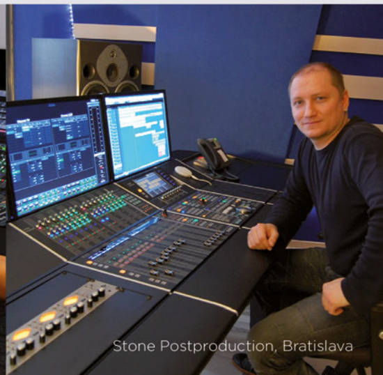
Stone Postproduction, Bratislava