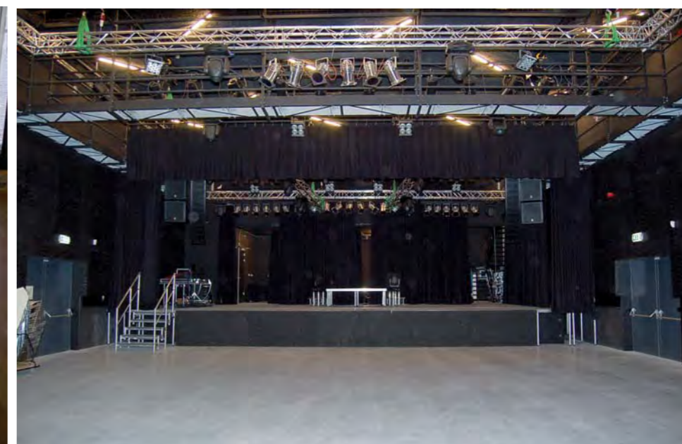
De popzaal heeft een capaciteit van 600 man. Voor dancefeesten is er een extra set SP2-10 beschikbaar. De aansturing van de popzaal gaat met een Yamaha M7CL 48 digital console en een Midas Siena monitortafel.

Aantal enthousiaste en tevreden gebruikers neemt toe