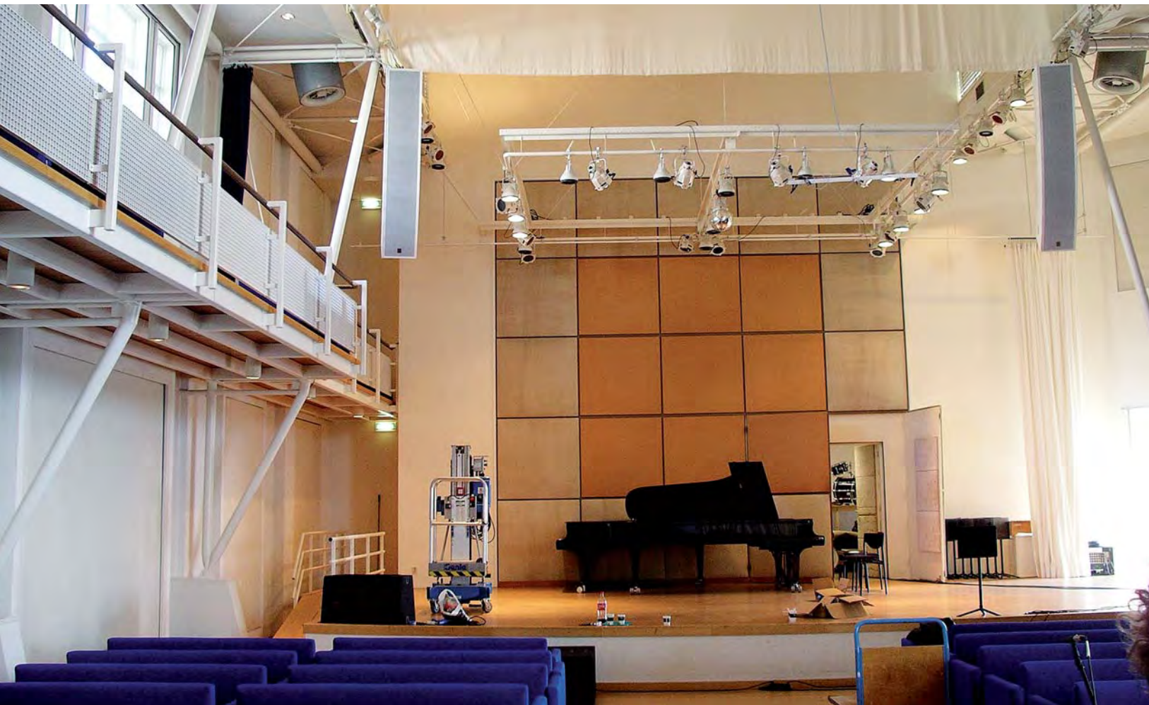
De DreamLine is bij Conservatorium ArtEZ in het wit gespoten dat beter paste bij de stijl van het interieur.

ook in combinatie met onze andere geluidssetjes." Naast de DreamLine beschikt Musis Sacrum nog over een Easy Tour set, een PM (Personal Monitor) set en drie X-act luidsprekers, die zowel als monitor als infill speaker worden gebruikt. "We kunnen 6 complete sets maken, waarvan 4 met laag. Alle systemen zijn zo uitgebalanceerd, dat ze moeiteloos door elkaar heen gebruikt kunnen worden. De flexibiliteit van het systeem is groot en iedereen kan er mee werken. We hebben vaak maar heel weinig ombouwtijd. Binnen 1 uur moet het staan. Met een normaal line-array systeem waarbij je kastjes aan elkaar moet klikken en vervolgens nog moet inpluggen op de versterkers, duurt dat veel langer. Wat dat aangaat is de DreamLine ideaal. Het systeem hangt hier aan een truss die met twee kettingtakels aan het plafond is vastgemaakt. Binnenkort komen er nog twee Sound Projects mid laag kasten bij die dezelfde afmetingen hebben als de DreamLine en een goede aanvulling vormen in het laag op de fullrange DreamLines. Kortom: de DreamLine is voor ons de ideale oplossing zowel kwalitatief als qua dekking", aldus Van Dalm.