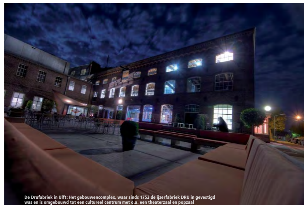
De Drufabriek in Ulf: Het bouwencomplex, waar sinds 1752 de ijzerfabriek DRU in gevestigd was en is omgebouwd tot een cultureel centrum met o.a. een theaterzaal en popzaal