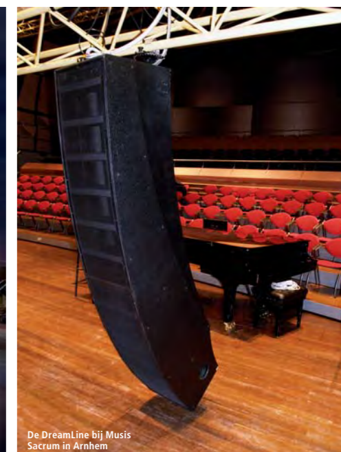
De DreamLine bij Musis Sacrum in Arnhem