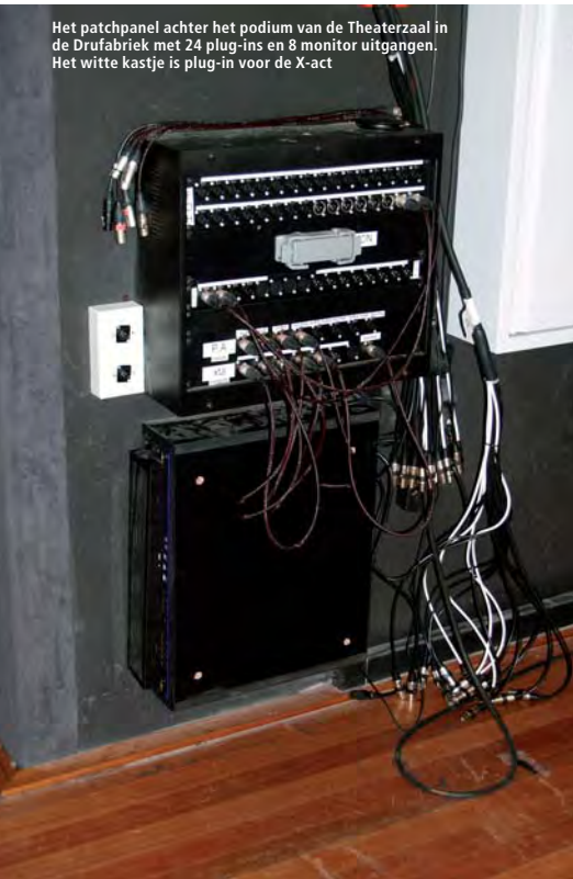
Het patchpanel achter het podium van de Theaterzaal in de Drufabriek met 24 plug-ins en 8 monitor uitgangen. Het witte kastje is plug-in voor de X-act