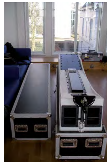
De DreamLine past complete in een flight case en kan op deze manier gemakkelijk vervoerd worden.